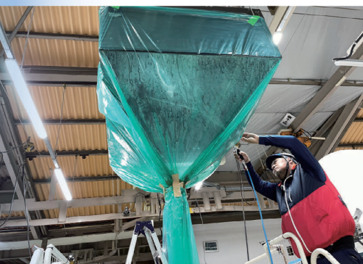
▲ 業務用エアコンの洗浄